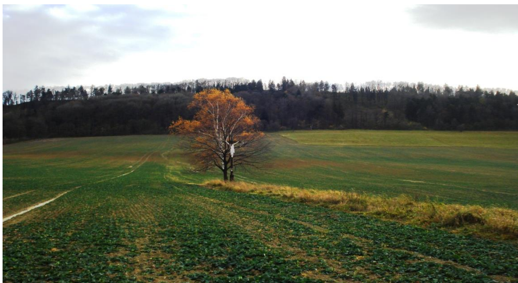
Pohled na Libhošťskou hůrku ze severní strany.