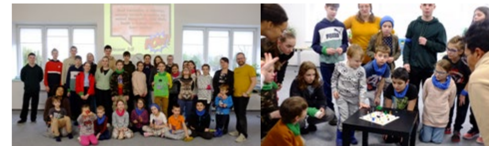
Kluby, spolky, organizace 9

Jarní prázdniny se již tradičně nesly ve znamení příměstského Lego tábora, který pořádá organizace Dětská misie společně se sborem Bratrské jednoty baptistů v Příboře na Mexiku. Společně s třicítkou dětí jsme se prohrabovali padesáti kily lega, které jsme využili při hrách, minutových výzvách i ztvárňování biblických příběhů. Biblické