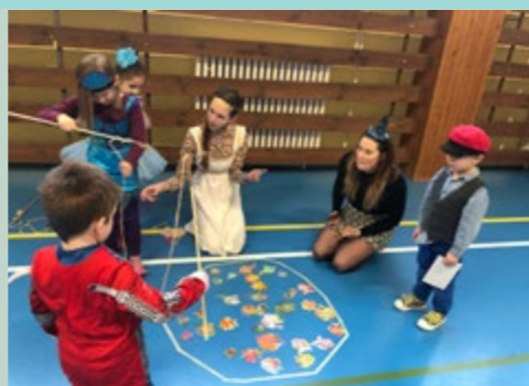
Kluby, spolky, organizace

tentokrát v maskách. Rodinné odpoledne se uskutečnilo v tělocvičně TJ na Štramberkové ulici. Letošním tématem se nesl duch olympijských her a heslo „Když nemůžeš,