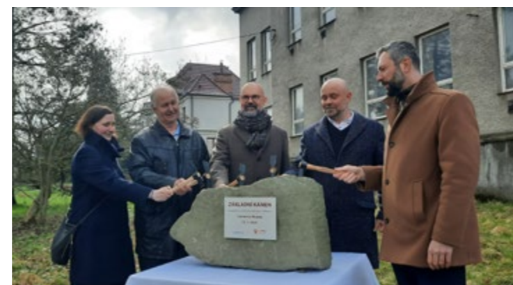
2 Slovo vedení města

Společně s projektem výstavby Domova se zvláštním režimem bude probíhat výstavba přístupové místní komunikace, která zlepší dopravní obslužnost objektu a zároveň umožní přístup do přilehlé zahrádkové osady. Městský úřad plánuje realizaci této investiční akce na podzim letošního roku.