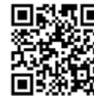
Leták sociální služby

speciální ochrannou deratizací povinna podle potřeby ve své provozovně zajistit každá fyzická osoba, která je podnikatelem, právnická osoba a každá osoba při likvidaci původců nákaz, při zvýšeném výskytu škodlivých a epidemiologicky významných hlodavců a dalších živočichů. Jde-li o obytné místnosti, pobytové místnosti a nebytové