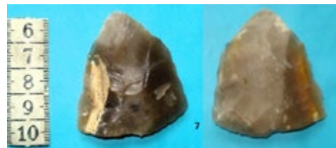
Obr. 3 Listovitý hrot z lokality Tisek – Folinky