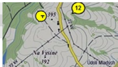
Obr. 2 Výřez z mapy s označenými archeologickými lokalitami Tisek – č.12 a Tisek 2 – T

asi 0,5 km. Na nověji objevené lokalitě Tisek 2 nebyl dosud nalezen žádný listovitý hrot, naopak na lokalitě Tisek Folinky bylo autorem příspěvku vyhledáno již 6 těchto typů hrotů a další ještě ve zlomcích. Poslední nález listovitého hrotu náleží Danielu Fryčovi ze dne 9. 3. 2024 při společné vycházce s autorem příspěvku, viz obrázek. Přes prostorovou blízkost obou stanovišť se jeví ta skutečnost při rozboru kamenné industrie, že z hlediska technologického a zastoupení vŕdčích typů nástrojů se nejedná o stejnou skupinu pravěkých lidí. Na lokalitě Tisek 2 jsou nástroje středopaleolitické, kdežto nástroje na lokalitě Tisek – Folinky obsahují i typy nástrojů, které by mohly signalizovat i příslušnost mladší, ke starší fázi mladého paleolitu a to aurigacienu.