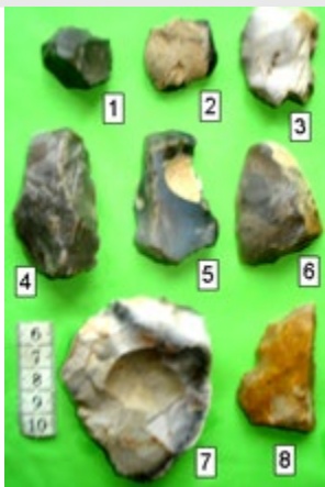
Obr. 1 Výběr kamenné štípané industrie z lokality Tisek 2. 1–9 drasadla a škrabadla.

asi 0,5 km. Na nověji objevené lokalitě Tisek 2 nebyl dosud nalezen žádný listovitý hrot, naopak na lokalitě Tisek Folinky bylo autorem příspěvku vyhledáno již 6 těchto typů hrotů a další ještě ve zlomcích. Poslední nález listovitého hrotu náleží Danielu Fryčovi ze dne 9. 3. 2024 při společné vycházce s autorem příspěvku, viz obrázek. Přes prostorovou blízkost obou stanovišť se jeví ta skutečnost při rozboru kamenné industrie, že z hlediska technologického a zastoupení vŕdčích typů nástrojů se nejedná o stejnou skupinu pravěkých lidí. Na lokalitě Tisek 2 jsou nástroje středopaleolitické, kdežto nástroje na lokalitě Tisek – Folinky obsahují i typy nástrojů, které by mohly signalizovat i příslušnost mladší, ke starší fázi mladého paleolitu a to aurigacienu.